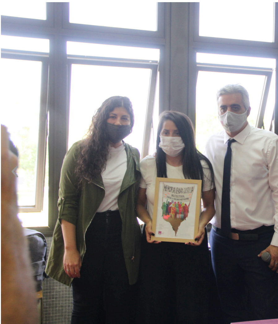
Multisectorial contra la Violencia